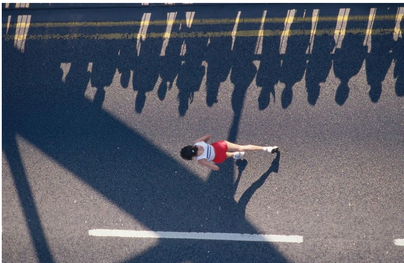
La marathonnienne a passé plus de quatre ans sur les routes du monde entier